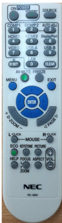
Obrázek číslo 2