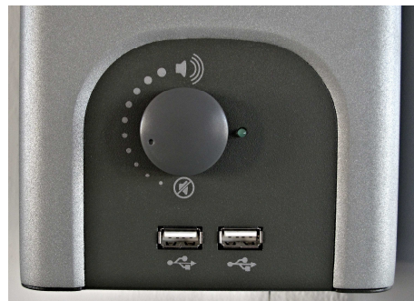
Obrázek číslo 3