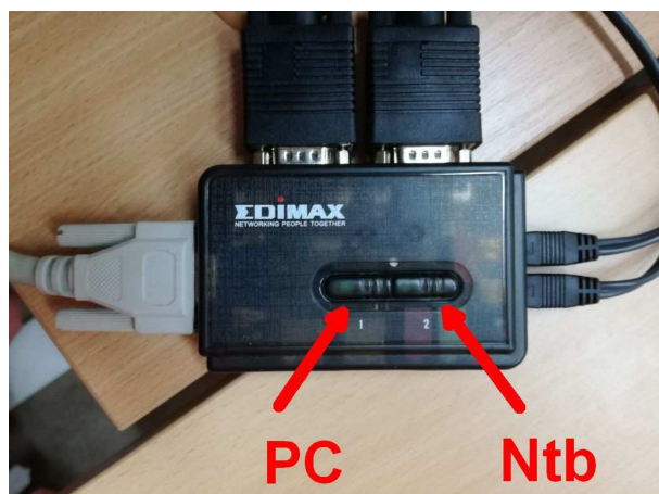
Obrázek číslo 4