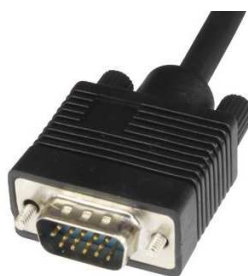
Obrázek číslo 2