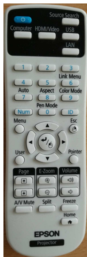
Obrázek číslo 3