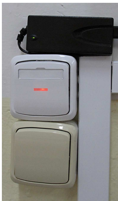
Obrázek číslo 1