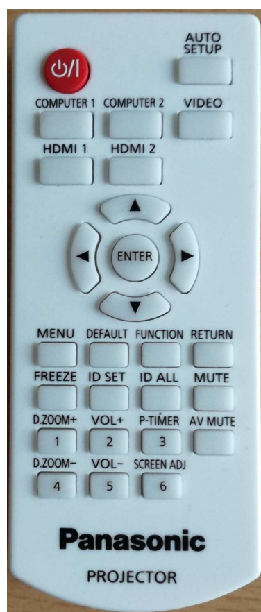
Obrázek číslo 2