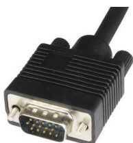
Obrázek číslo 3