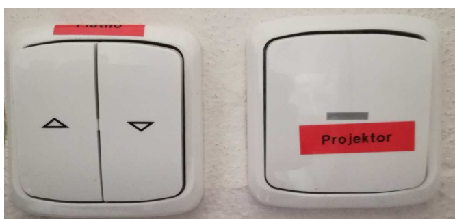
Obrázek číslo 1