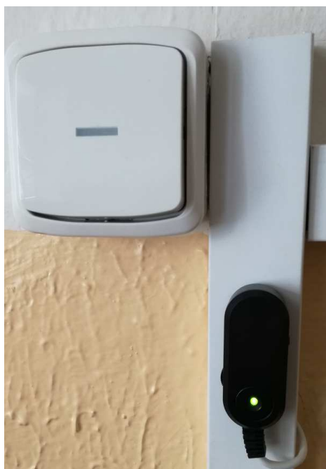
Obrázek číslo 1