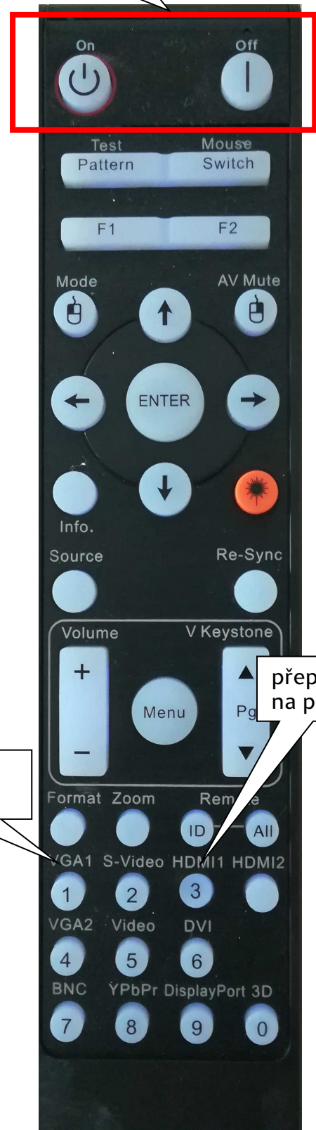
přepnutí na počítač