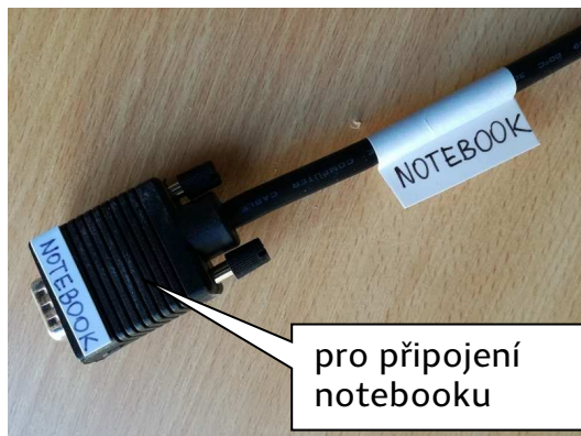
pro připojení notebooku