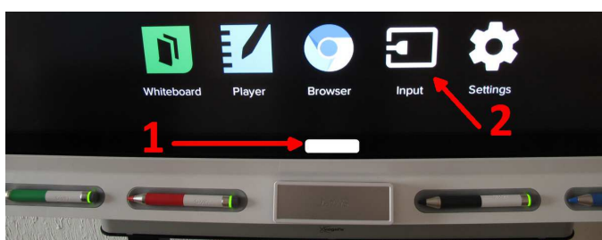
Obrázek číslo 3