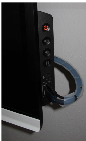
Obrázek číslo 2