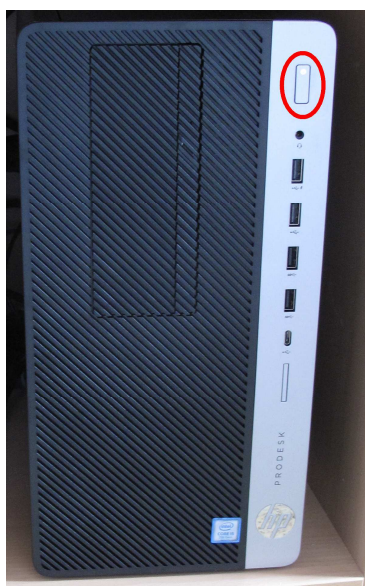
Obrázek číslo 1