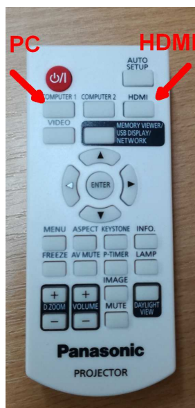
Obrázek číslo 2