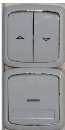
Obrázek číslo 1