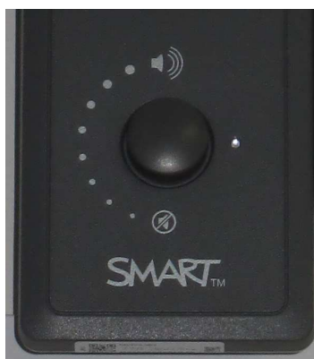
Obrázek číslo 3